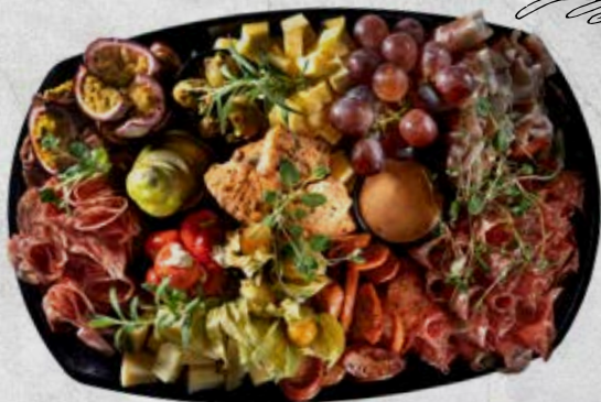
Dekor av frukter (jordgubbar, ananas, passionsfrukt, druvor, physalis)

Minsta antal är 6 personer vid beställning