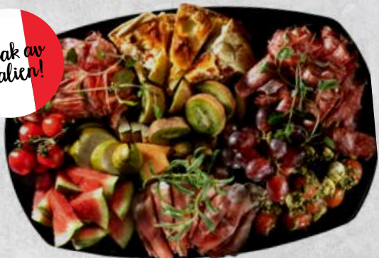
Dekor av frukter (jordgubbar, ananas, passionsfrukt, druvor, physalis)

Minsta antal är 6 personer vid beställning