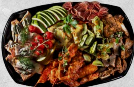
Dekor av frukter (jordgubbar, ananas, passionsfrukt, druvor, physalis)

Minsta antal är 6 personer vid beställning